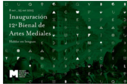
La 12ª Bienal Artes Mediales 2015 se lleva a cabo desde el 8 al 25 de octubre en el Museo Nacional de Artes Mediales.

"Hace tiempo trabajo con fechas, con distintos acontecimientos emblemáticos de manifestaciones públicas. Desde el 1 de mayo, hasta el 11 de septiembre que es la conmemoración del golpe militar. Hace cinco años que estoy construyendo un archivo de la